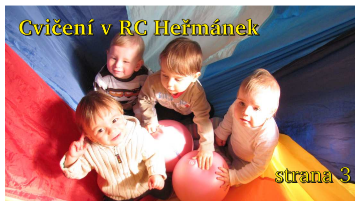
Cvičení v RC Heřmáněk