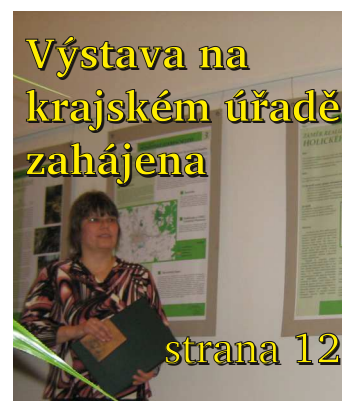
Výstava na krajském úřadě zahájena