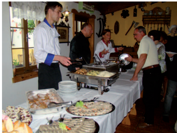
SLEZSKO NA TALÍŘI. Na výsluní krajové gastronomie je od první ochutnávky i slezská kuchyně.