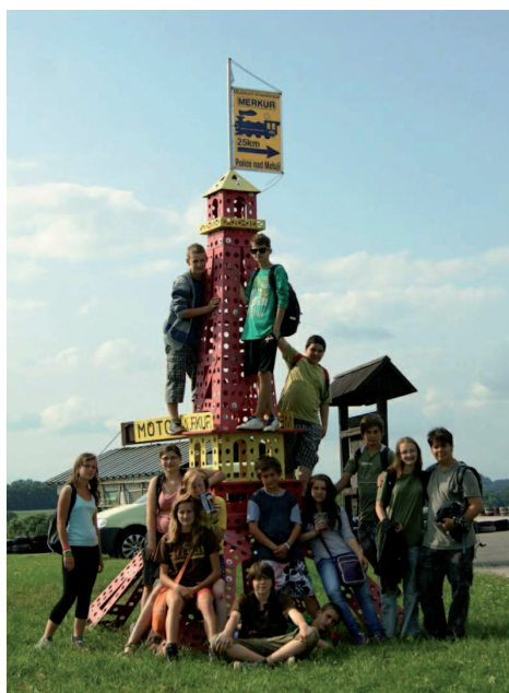
EXPEDICE APALUCHA. Duha Velká Medvědice je originální spolek fajn lidí, který připravuje duhově barevné programy pro aktivní volný čas dětí a mládeže – jednodenní či víkendové akce v přírodě, doma i ve světě zaměřené na turistiku, sporty a hry, amatérskou kulturu a mezinárodní výměny mládeže.