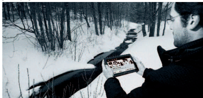
S MOBILEM ZA PŘÍBĚHEM ALOISE NEBELA. Uživateli nové aplikace se dostanou například do míst, kde se na Jesenícku těžilo zlato, soudily čarodějnice nebo k zaniklé lesní železnici.