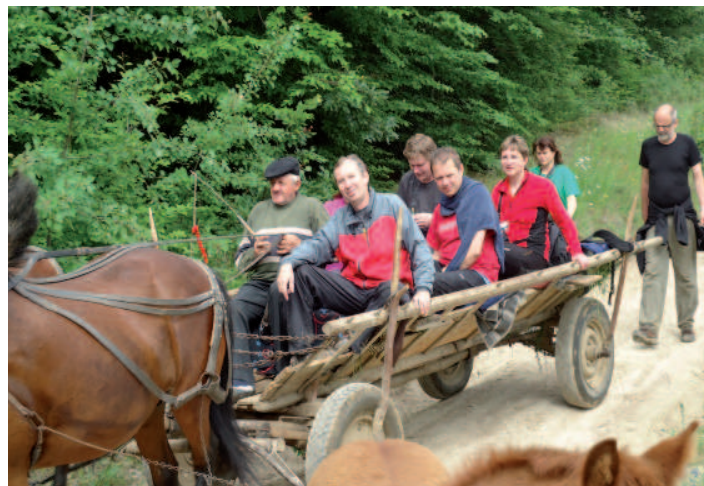
AGROTURISTIKA. Krajanům pomůžete, když využijete místní ubytování, stravování nebo dopravu. Z Gerníku do Rovenska jeli účastníci olomoucké expedice Banát na žebříňáku.

Také jsme u krajanů nakoupili cujku – místní pálenku, med, domácí sýry, ručně dělané papuče, šípková povídla a jednu klasickou nůši. Nakupovali jsme v místních obchodech a najali si koňské povozy. Lidé z Banátu nemají možnost si najít práci a jsou připraveni přijmout turisty.