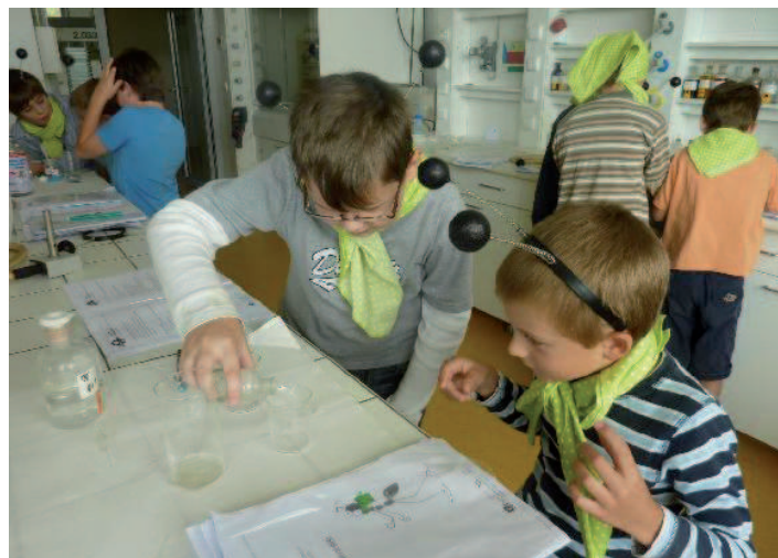
JAKO MRAVENCI. Na příměstském táboře v laboratoři přírodovědecké fakulty si děti vyrobí například zmrzlinu z jogurtu pomocí tekutého dusíku nebo sestrojí vlastní kompas.