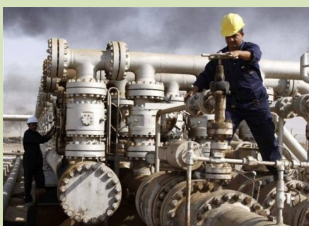
Do Polska za plynem z břidlic