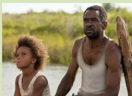
Divoká stvoření jižních krajín

2 | 2013 | bulletin asociace Přátelé přírody ČR | www.pratele-prirody.cz | zdarma