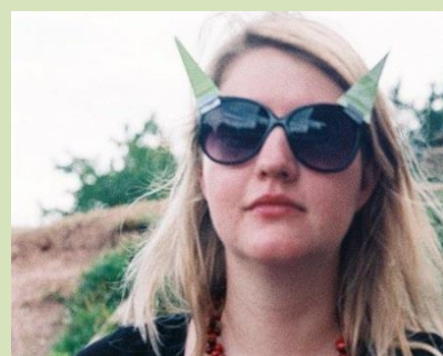
Ewka: Dodávám věcem šťávu