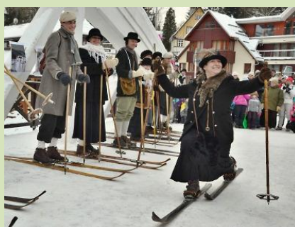
KRNAP slaví padesátku