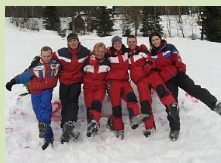
Arabela lyžuje u Lucifera