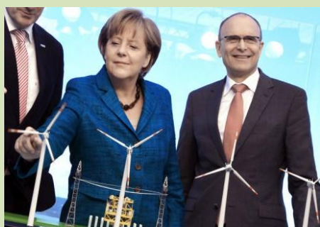
Trh s elektřinou v Německu

1 | 2013 | bulletin asociace Přátelé přírody ČR | www.pratele-prirody.cz | zdarma