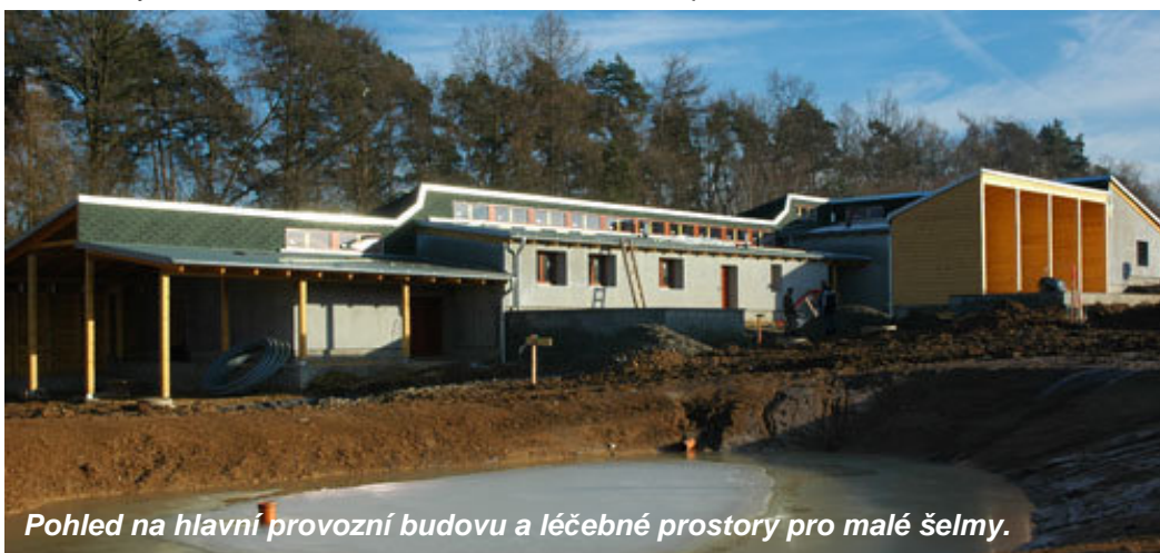
Pohled na hlavní provozní budovu a léčebné prostory pro malé šelmy.

Záchraná stanice pro živočichy ČSOP Vlašim