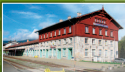
Železná Ruda – Alžbětín