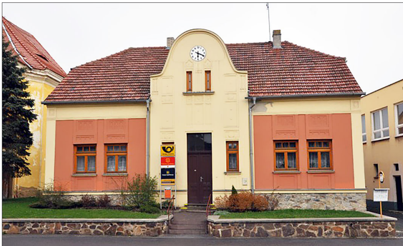
Pošta v Pavlíkově