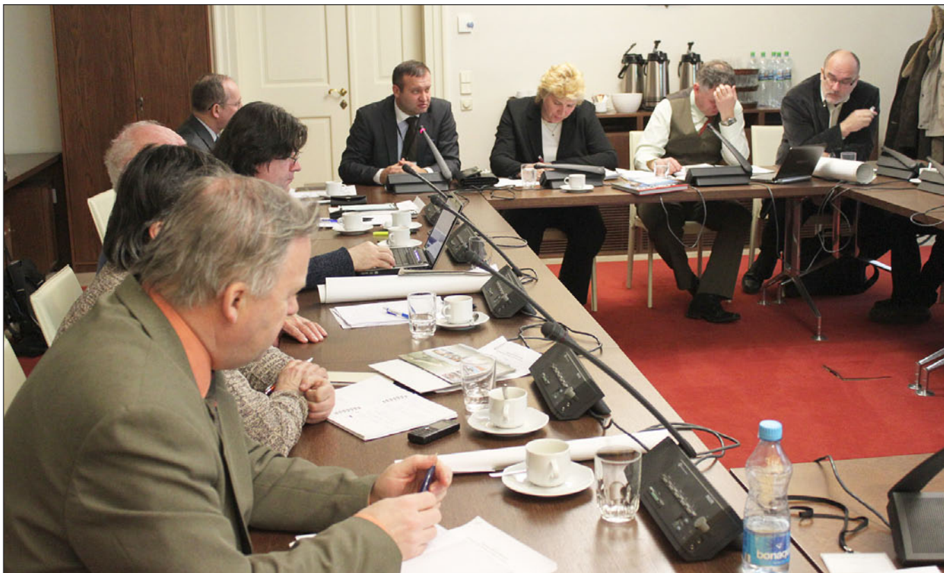
Únorová schůze SPOV v Senátu