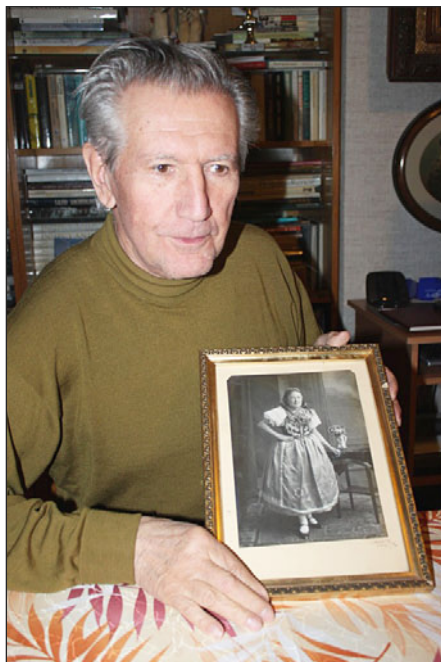
„To je moje maminka, když jí bylo osmnáct. Má na sobě tuřanský kroj.“

Kladme si všichni tuto otázku. Rakušané měli to štěstí, že jejich život nebyl narušen komunismem. A tak je vidět na první pohled, že zůstal neporušen i jejich vztah ke krajině. To, o čem tady celou dobu hovoříme. Zůstává jim jejich vztah k tradicím i k dědictví jejich otců – což není jen ten barák, ale i duchovní rozměr. Mladí lidé, kteří tam zdědí nějakou nemovitost, se k ní chovají ucti-