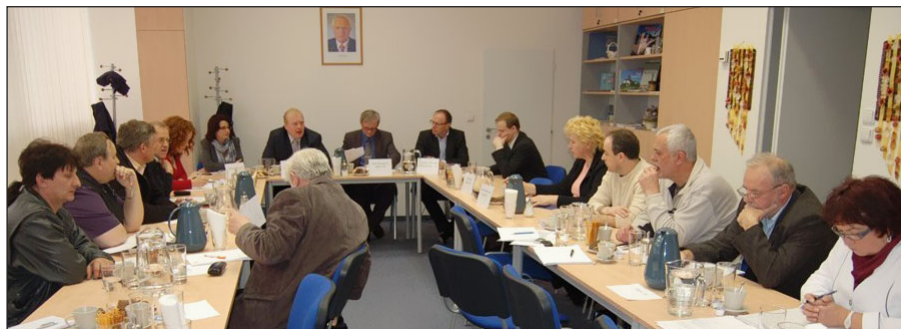
Jednání zástupců organizací venkova s představiteli České pošty