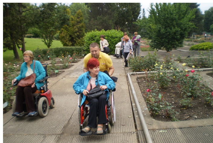
MEZI RŮŽEMI. Roska má ve znaku poupě růže. I proto se její členové sešli právě v rozáriu.

ce, které jsou zapojeny do celosvětového hnutí RS. Ke Světovému dni RS se dosud přihlásilo 40 zemí. (red)