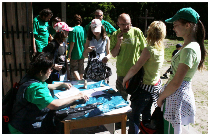
VZHŮRU DO HOR. Na konci trasy vám rádi vyhodnotíme čas strávený na trati či úbytek váhy a změříme velikost vašeho nadšení, slibují organizátoři pochodu za krásami Rychlebských hor.

Historie Rychlebské spadá až do roku 1974, kdy se konala poprvé. Turisté se na ní scházeli pravidelně do roku 1985. Znovuobnovená tradice se datuje od roku 2009. „U zrodu pochodu stáli mí rodiče s přáteli, kteří jej po celou dobu pořádali a organizačně vedli. Za