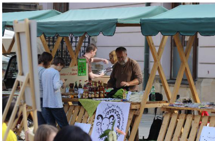
TRADICE. První máj patří v Olomouci Ekojarmarku. Letos na něm mohli lidé ochutnat maďarský salám nebo slovenskou slivovici. Příští rok EDO oslaví čtvrt století s návštěvou z Islandu a Norska.

Díky podpoře International Visegrad Fund se projektu zúčastnili i partneři z Maďarska, Polska a Slovenska. Přijeli zástupci maďarského národního parku Duna-Ipoly, slovenského Centra environmentálních aktivit Trenčín a polského sdružení Stowarzyszenie Fundus Glacensis podporujícího ob-