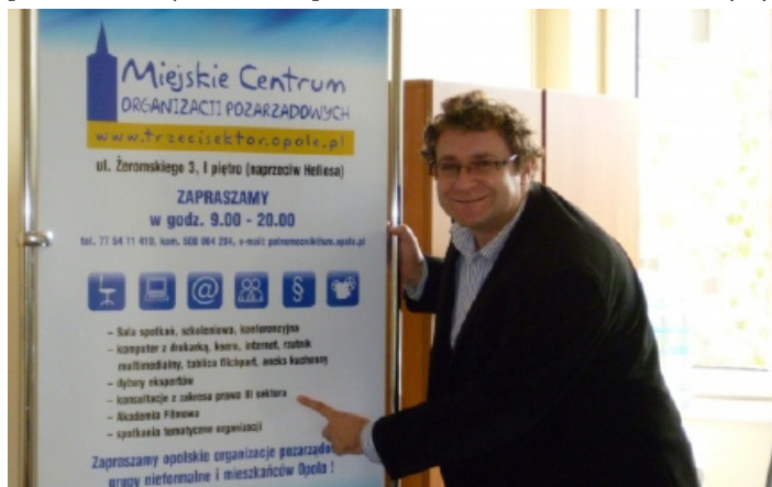
VÍTEJTE V OPOLI. V opolském Centru neziskových organizací mají otevřeno od rána do večera.