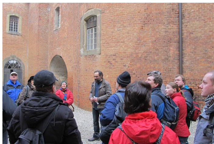
FORTY JAKO HIT. Vycházka po pevnostkách měla být komorní akcí. Nakonec přišlo přes 50 lidí.

morní akcí. Dav trochu prořídil po prvním navštíveném fortu, Lazeckém. Ten je otevřený teprve asi půl roku, a tím pádem téměř pro každého neznámý. Zdejší správce nejprve promítl film o olomouc-