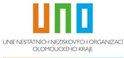
Unie nestátních neziskových organizací Olomouckého kraje