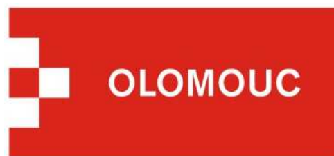
Statutární město Olomouc