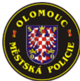
Městská policie Olomouc